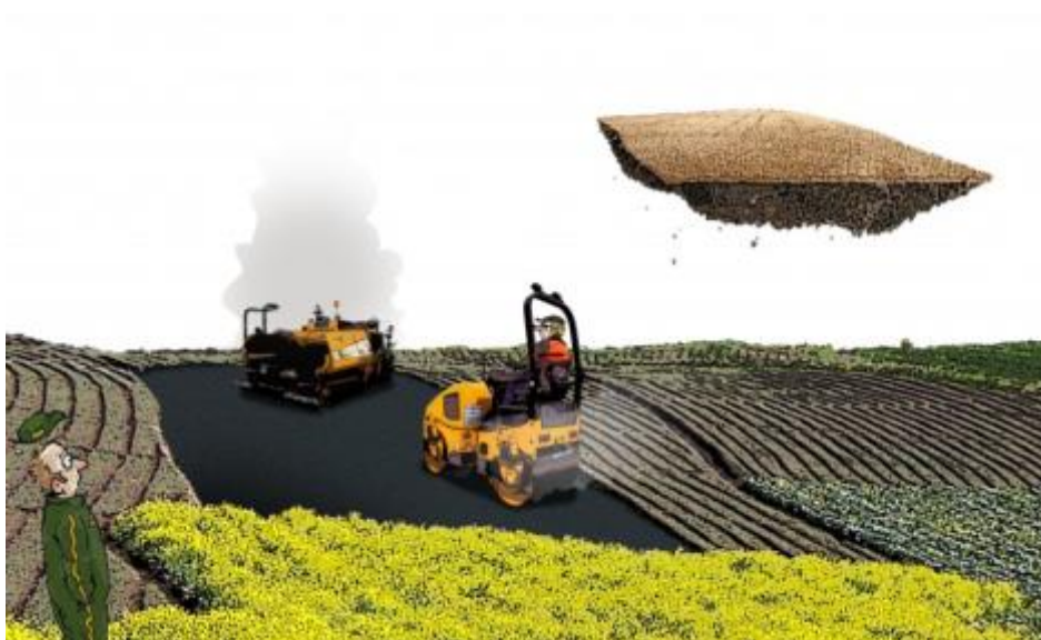
Illustrasjon: Sven Tveit

Så mens delegasjonen på radioen forargar seg over dei lokale politikarane sin veikskap i møte med handels-