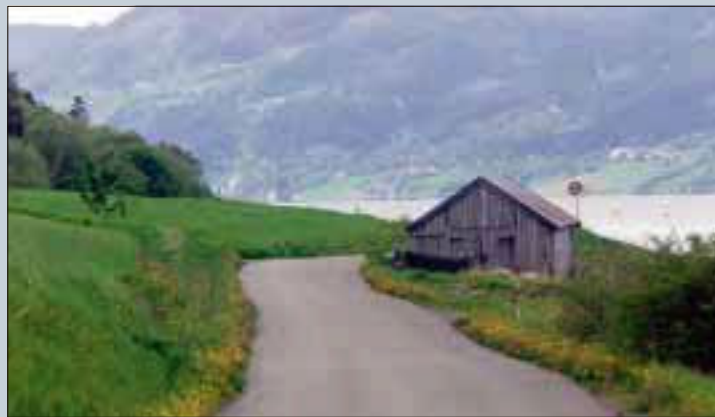
UFORLØYST POTENSIAL: Det på små stader i distrikta ein finn handfast materialitet produsert for eksport, skriv artikkelforfattarane.

Då industribedriftene på Nordvestlandet laut tole skyhøge energiprisar