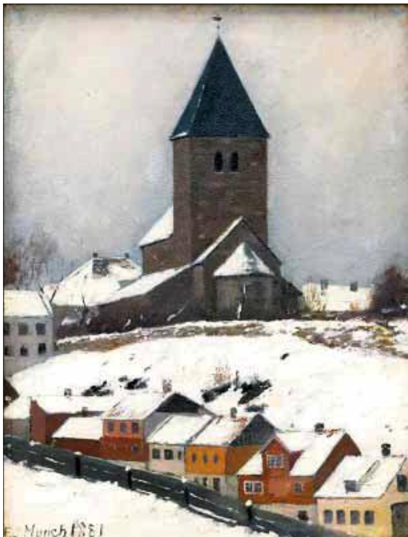
Munch I Oslo viser Munch-museet utstillingen «Munch blir 'Munch'. Kunstneriske strategier 1880 – 1892» fram til 11. januar. Her «Gamle Aker kirke», 1881, olje på papp.